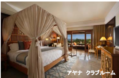
アヤナ クラブルーム