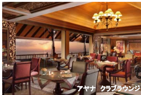
アヤナ クラブラウンジ