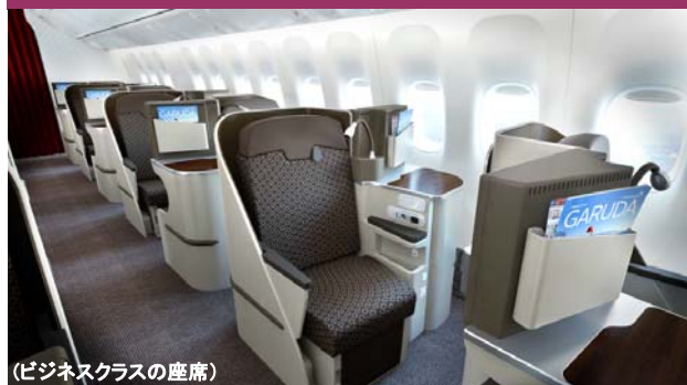
(ビジネスクラスの座席)

●ガルーダインドネシア航空は「スカイトラック社」でわずか7社しか選ばれていない5つ星エアラインのひとつです。