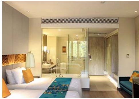
クラシックルーム