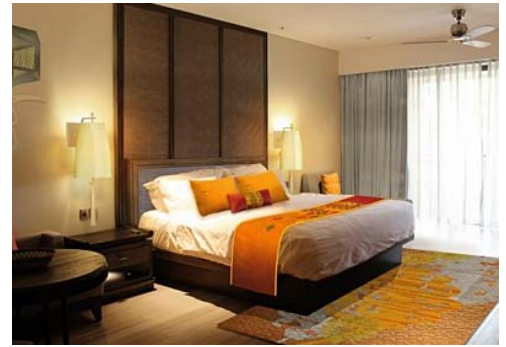
ジュニアスイート