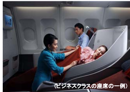
(ビジネスクラスの座席の一例)

●ガルーダインドネシア航空は「スカイトラック社」でわずか7社しか選ばれていない5つ星エアラインのひとつです。