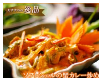
ソフトシェルの蟹カレー炒め

本館の豪華なインテリアと、絶品を披露したギャラリー風のインテリアが人気のタイ家庭料理レストラン、ルー・マニア大使館がった洋館を改装した、一軒家レストランです。1997年～2005年まで9年連続でタイベストレストランに選ばれたまさに名店。数々のタイ料理と、世界中のワイン、優雅な時間に食後の美意識が集まります。 ”高肉アート”と”高級フード”、その2つを同時に堪能できるバーンカニタもギャラリーにて、本場のタイ料理をお楽しみください。