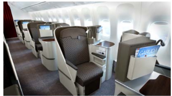
(ビジネスクラスの座席の一例) ●ガルーダインドネシア航空は「スカイトラック社」でわずか7社しか選ばれていない5つ星エアラインのひとつです。