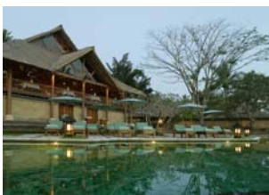
(アマンドリ プール)