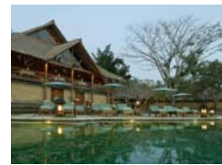
(アマヌダリ:プール)