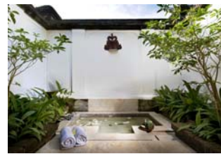
(アマンドリ バスタブ)