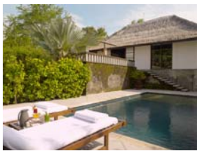
(アマサ プールスイート)