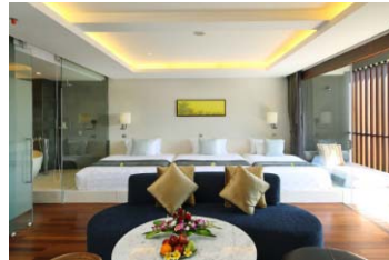
(スイートのお部屋の一例) ※最大収容人数は6名(添い寝を含む)