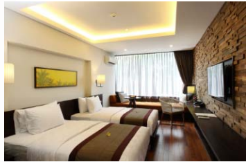
(スーペリアのお部屋の一例) ※最大収容人数は3名(添い寝を含む)