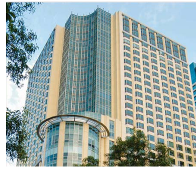
(ニューワールドマニラベイ)