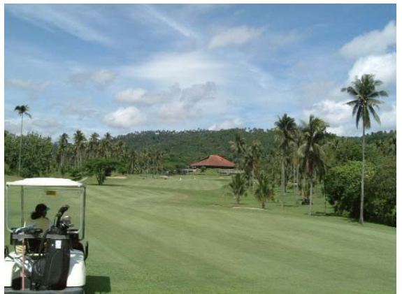
(カナルバン ゴルフ&カントリークラブ)

●カナルバン ゴルフ&カントリークラブ 南北コースがあり、計36ホール。南北共にフィリピンを代表するチャンピオン・コース。ロバートT・ジョーンズJr.の傑作。数多くの椰子の木が植えられており、南国ムードが漂うコースとなっています。