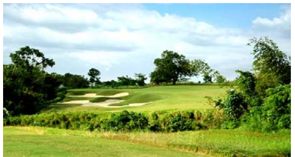
(シャーウッド ヒルズ ゴルフ クラブ)

ジャック・ニコラス氏自らが監修したゴルフ場。 雄大なフェアウェイもグリーンもメンテナンス良好。 南国の豊かな自然の地形を利用し、戦略性の高いコースが魅力。