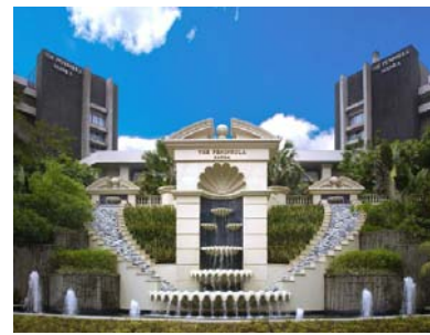
(ペニンシュラマニラ)