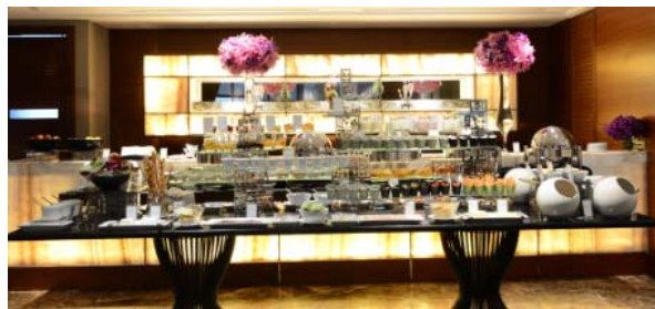
(インターコンチネンタル パンコク ラウンジ)