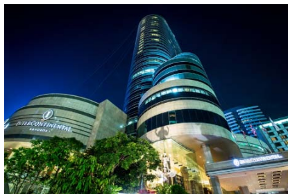
(インターコンチネンタル パンコク 外観)