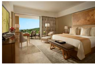
(ムリア リゾート/グレンジャールームのお部屋)