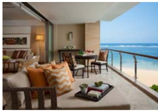
(ザ・ムリア/お部屋からの眺め)