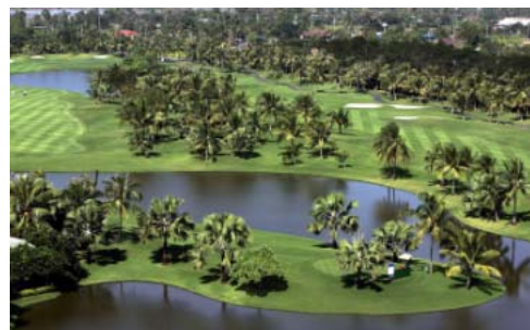
(タイカントリークラブ)

米国PGA国際公認コースとして1996年12月にオープンしたアジアでもトップクラスの名門コースで、タイガーウッズが初めて優勝したコースとしても有名。「ザ・ペニンシュラ・バンコク」が経営するクラブハウスやレストランのホスピタリティの高さも魅力です。