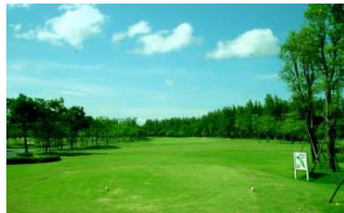
(キタアニカントリークラブ)

1991年にオープンした日系ゴルフ場。平坦で直線的なフェアウェイが多く初心者向けで、上級者なら良いスコアが期待できるコース。日本人スタッフが常駐し、日本語を話せるキャディやスタッフもいるので安心してプレーできます。また日本食レストランもあり、人気のカツカレーや親子丼など、味も本格的。日系ならではの日本人向けサービスが最大の魅力です。