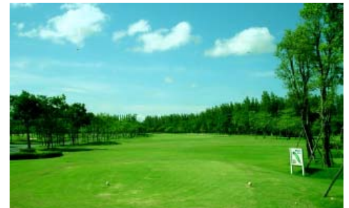
(キアタニカントリークラブ)

● キアタニカントリークラブ 1991年にオープンした日系ゴルフ場。平坦で直線的なフェアウェイが多く初心者向けで、上級者なら良いスコアが期待できるコース。日本人スタッフが常駐し、日本語を話せるキャディやスタッフもいるので安心してプレーできます。また日本食レストランもあり、人気のカツカレーや親子丼など、味も本格的。日系ならではの日本人向けサービスが最大の魅力です。