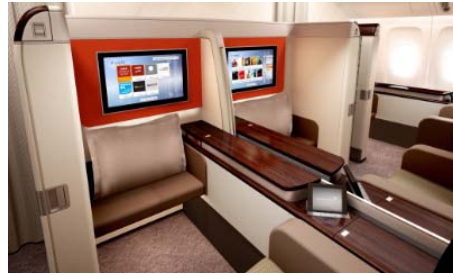
(ファーストクラスの座席)

●ガルーダインドネシア航空は「スカイトラック社」でわずか7社しか選ばれていない5つ星エアラインのひとつです。