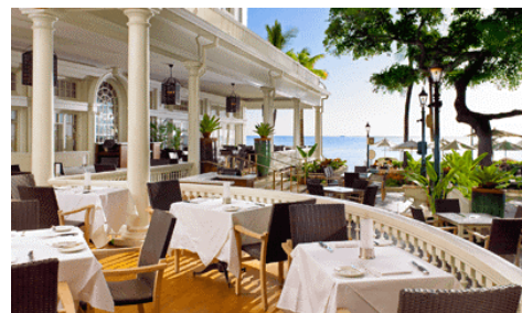
※レストラン「ザ・ベランダ」