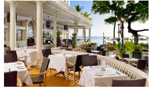
※レストラン「ザ・ベランダ」