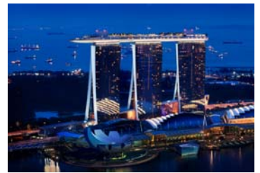
マリーナベイサンズ