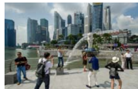
(マーライオン公園)