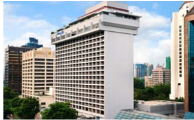
ヒルトンシンガポール