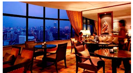
(インターコンチネンタル バンコク ラウンジ)

バンコク(スワンナプーム)空港から車で50分。セントラルワールドプラザやBTS「チットロム」駅に近い高層デラックスホテルです。 ビジネス街とショッピング街の中心にあり、ロケーションは抜群です。