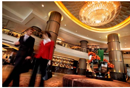
(インターコンチネンタル パンコク ロビー)