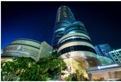
(インターコンチネンタル パンコク 外観)