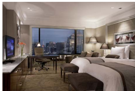
(インターコンチネンタル バンコク お部屋の一例)