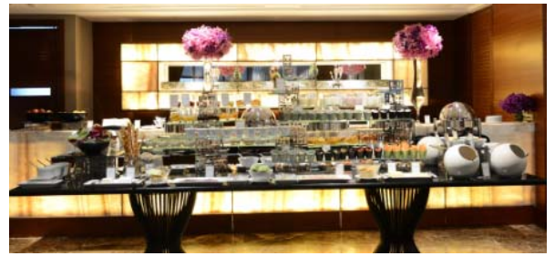
(インターコンチネンタル パンコク ラウンジ)