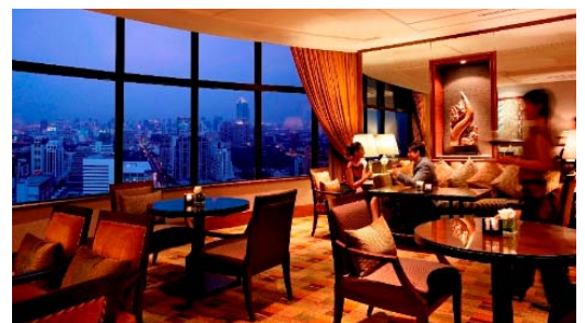
(インターコンチネンタル バンコク ラウンジ)

バンコク(スワンナプーム)空港から車で50分。セントラルワールドプラザやBTS「チットロム」駅に近い高層デラックスホテルです。 ビジネス街とショッピング街の中心にあり、ロケーションは抜群です。