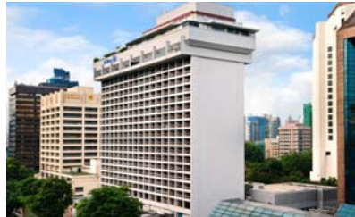
ヒルトンシンガポール