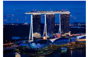
マリーナベイサンズ