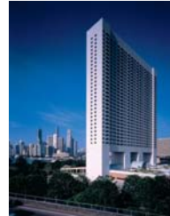
ザ・リッツカールトン ミレニア