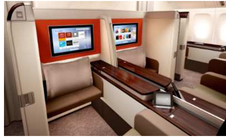
(ファーストクラスの座席)

●ガルーダインドネシア航空は「スカイトラック社」でわずか7社しか選ばれていない5つ星エアラインのひとつです。