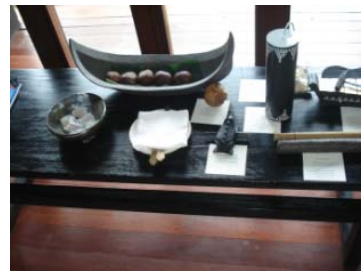
<小物 プレゼント(一例)>