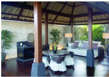
<オーシャンビューヴィラ:リビング>