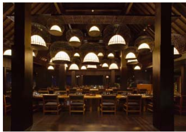
<レストラン:サンカール>