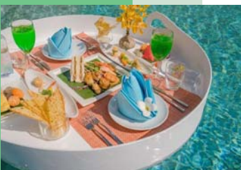
アクアティックランチ イメージ

《特典》 アクアティックランチ1回(2名様まで)、WiFi無料、到着時ウェルカムドリンク、おしぼり、自転車レンタル2時間無料、パトビーチまでの無料シャトル、ウェルカムココナッツ