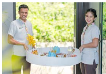
アクアティックランチ イメージ

ホテルの特典につきましては、予告なく変更される場合がございます。あくまでもホテル側のサービスとなりますのでその場合の返金等はございません。