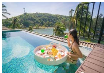
アクアティックランチ イメージ