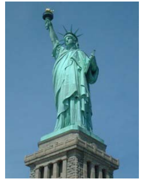
自由の女神(イメージ)

※デルタ航空の成田＝北米直行便を利用。 ※ホテル指定コースも多数のラインアップで、すべてマンハッタンのミッドタウン中心にセレクト。ショッピングや街歩きにも最適です。 ※空港⇄ホテルの往復日本語送迎付です。 ※日本国内各地からお得な代金でご参加できます。(別途国内線空港使用料がかかる場合がございます) ※【ひとり旅】もOK! 1名様から催行いたします。