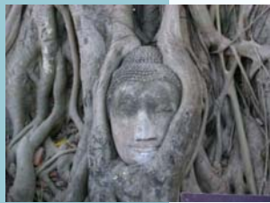
(ワット・ブラ・マハタート)