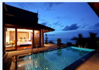
《ヒルトッププールヴィラ/イメージ》