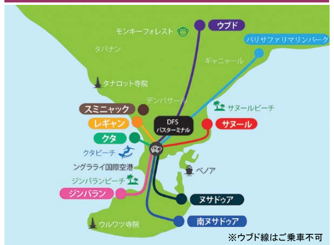
※ウブド線はご乗車不可

クラクラバスはバリ島リゾートエリアを結ぶ公共バスです。クタのシンバンシウル交差点に位置するDFSバスターミナルを中心に、6路線をご利用いただけます。しかも、現地でお渡しする「3DAY Pass」は3日間有効の乗り放題! 1日は24時間として計算されますので、最初に読み取り機にタップした時刻からカウントされます。(DFS発以外にスミニャック線もあり、計7路線にご乗車OK)