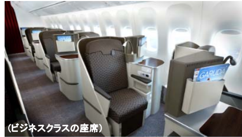
(ビジネスクラスの座席)

●ガルーダインドネシア航空は「スカイトラック社」でわずか7社しか選ばれていない5つ星エアラインのひとつです。