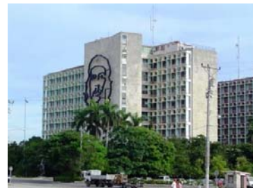
ハバナ市内(イメージ)