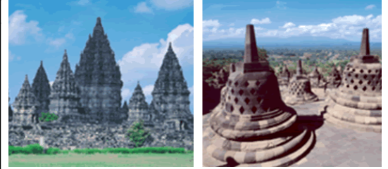
(ブランバナン遺跡/イメージ)