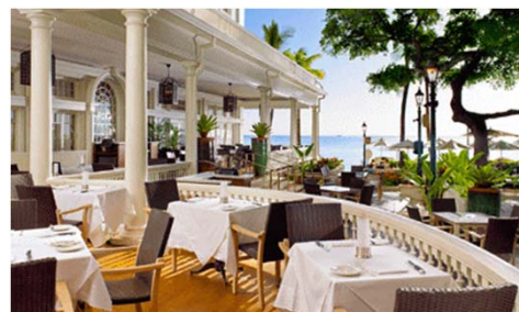
※レストラン「ザ・ベランダ」