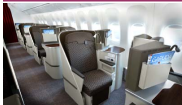
(ビジネスクラスの座席の一例)

●ガルーダインドネシア航空は「スカイトラック社」でわずか7社しか選ばれていない5つ星エアラインのひとつです。