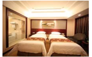
ヴェーナインターナショナルホテル