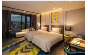
ミニマックスプレミアホテル上海虹橋