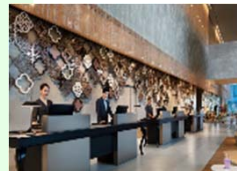
Day Time Hotel Lobby