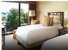
Day Time Deluxe Room