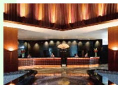
Day Time Hotel Lobby