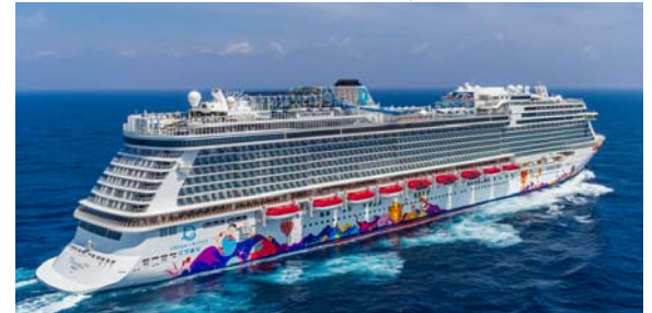
就航: 2017年 総トン数: 150,695トン 全長: 335m 全幅: 40m 客室数: 1,686室 乗客定員数: 1,686名 乗客定員数: 3,376名