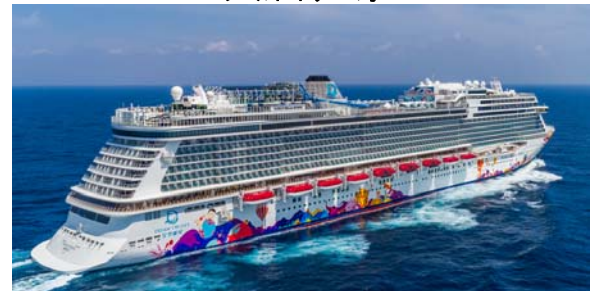
就航：2017年 総トン数：150,695トン 全長：335m 全幅：40m 客室数：1,686室 乗客定員数：1,686名 乗客定員数：3,376名