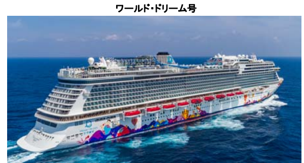
ワールド・ドリーム号 就航: 2017年 総トン数: 150,695トン 全長: 335m 全幅: 40m 客室数: 1,686室 乗客定員数: 1,686名 乗客定員数: 3,376名