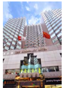
キンパリーホテル