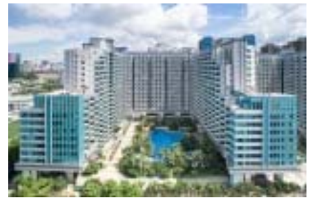
カオルーンハーバーフロント