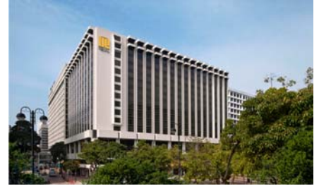
リーガルカオルーン