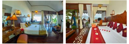
ビーチフロントスイート