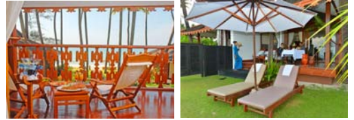
シービューデラックスルーム