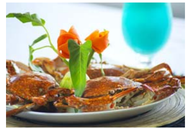
ハネムーンディナー