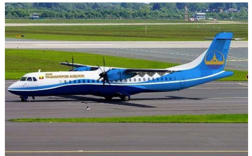
ミャンマー国内線（イメージ）