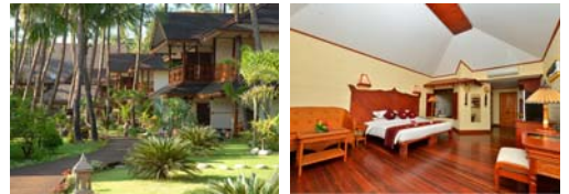
シービューデラックスルーム