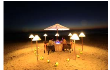
ハネムーンディナー