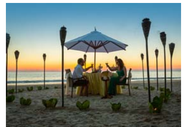
ハネムーンディナー

お客様の状況によっては、当初の手配内容に含まれていない特別な配慮、措置が必要になる可能性があります。特別な配慮・措置が必要となる可能性がある方は、ご相談させていただきますので、必ず申し出ください。 詳細は旅行条件書のお申し込み条件を確認の上、成田空港施設使用料・及び保安料、現地空港税は、旅行代金に併せてお支払いください。燃油サーチャージは旅行代金に含まれています。 パスポート(旅券)の残存期間は、入国時6ヶ月以上必要です。 2歳以上12歳未満のお子様は大人代金と同額。2歳未満で航空座席・ベッドを使用しない方は50,000円となります。但し、幼児の方が航空機の座席、現地でのサービスなど必要な場合は子供代金が必要となります。 燃油サーチャージは旅行代金に含まれています。旅行契約成立後に燃油サーチャージが増額又は減額・廃止されても増額分の徴収ならびに廃止を含む減額の返金はございません。(航空座席/エコノミー席利用) 現地送迎・観光等の移動は、他のパッケージツアーの方と混乗になる場合があります。 スケジュールにある観光・送迎等の変更・放棄はできません。 チェックイン・チェックアウトの際に、車内又はロビー等でお待ちいただく場合があります。 スケジュールは道路事情により前後する場合があります。 表記レストランは現地都合により実施日変更や他同等クラス店舗利用の場合があります。 観光中には土産物店へご案内いたします。これはお土産物店入店や物品購入を強制するものではありません。お買物に際してはお客様の責任で購入して頂きます。 ホテルからのおもてなしがある場合は、現地に必ずお受け取り願います。帰国後の対応はできませんので予めご了承ください。提供がない場合は、ホテルフロント又は現地係員にお申し出ください。 平成31年1月7日以後に出国する旅行者から国際観光旅客税(1,000円/大人子供同額・2歳未満非課税)が導入されます。当社のツアーでは2月1日以降にご出発されるお客様については、国際観光旅客税が導入される1月7日以降に発券することとなりますので、本税を徴収させていただきます。