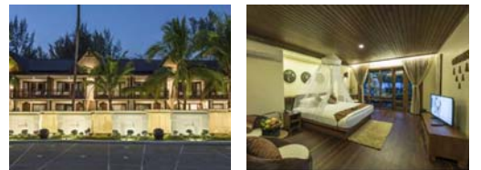
デラックスルーム