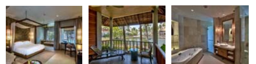
デラックスルーム デラックスルーム デラックスルーム