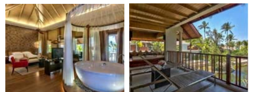
ラグーンスイート ラグーンスイート

■最少催行人員/2名 ■添乗員/同行致しません。現地係員がご案内致します。 ■利用航空会社/全日空（エコノミークラス） ■食事/（6日間）朝食4回、昼食1回、夕食2回 ■利用ホテル（指定不可） 【デラックス ホテル】 《ヤンゴン》：セドナホテル、チャトリウムホテルロイヤルレイク、パークロイヤルホテル、ロッセホテルヤンゴン、パンパシフィックホテル、メリアホテルヤンゴンのいずれか。 《ガバリビーチ》：ヒルトン・カバリ・リゾート&スパ 【スーペリア ホテル】 《ヤンゴン》：スカイスターホテル、グリーンヒルホテル、レノホテル、サマーミットパークビューホテル、ホテルヤンゴン、TRYPバイウィングダムヤンゴンホテル、イビススタイルズヤンゴンスタジアムのいずれか。 《ガバリビーチ》：ヒルトン・カバリ・リゾート&スパ ★国内線フライト状況・渋滞状況の現地事情により行程の入れ替え（観光の順番等）の可能性もございます。予めご了承ください。 ＜旅のポイント＞ ミャンマー敬虔な仏教徒です。全てのパゴダに当てはまりますが入場の際、服装には、十分注意が必要です。 男性は、短パン（七部丈含む）、タンクトップなど、女性は、ノスリーブ、ミニスカートなど肌の露出を控えた服装の着用をお願いします。 また、パゴダ内 入場の際は、裸足になります。靴下、ストッキングも不可となります。