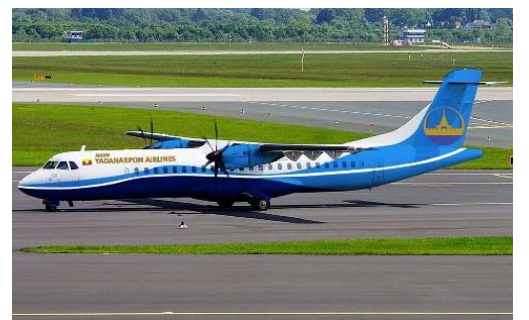
ミャンマー国内線（イメージ）